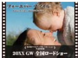
映画、音楽、ブランディング等