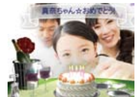
シーズン・イベント等

【採用例】「MYスライドビデオ」(国内主要通信事業者へ対応)、国内MVNO事業者サービス