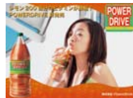
製品、会員サイト等